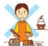
正月、節供等のために 日常より特別な手間 をかけて行う調理