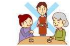
来客の応接 (お茶、食事の手配等)