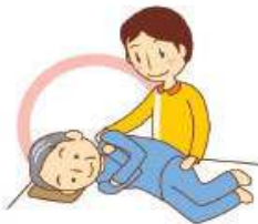
着替えの介助・体位変換