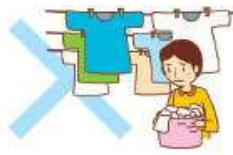
利用者以外の者に係る 洗濯、調理、買物、布団干し

✕ ※外出介助は利用者の趣味 趣向に係わる外出への同行は できません。 例えば、カラオケ・パチンコ・観劇・ お祭り・老人会への参加 など お墓参り・冠婚葬祭は家族などが 介助することが原則です。