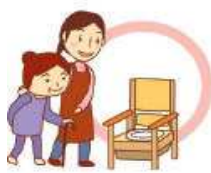
排泄介助 (トイレやポータブルトイレの 利用の介助、おむつ交換)