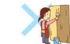
室内外家屋の修理 ペンキ塗り