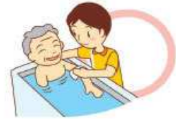
身体的清拭・入浴の介助