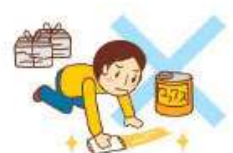
大掃除、窓のガラス磨き 床のワックスかけ