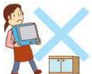
家具・電気器具等の 移動、修繕、模様替え