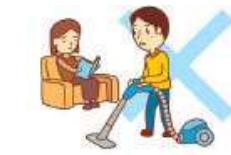
主として利用者が 使用する居室以外の掃除