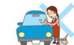
自家用車の洗車・清掃