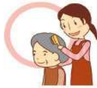
身だしなみの整容・洗面