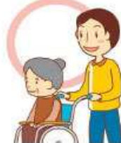
退院・外出等の介助