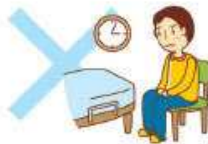
単なる見守り(留守番)や 話しみの相手