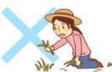
草むしり・花木の水遣り 植木の剪定等の園芸