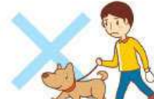
犬の散歩等ペットの世話