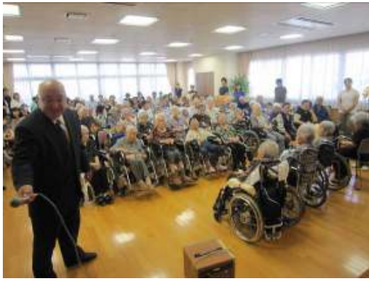
総勢120名以上でお祝い