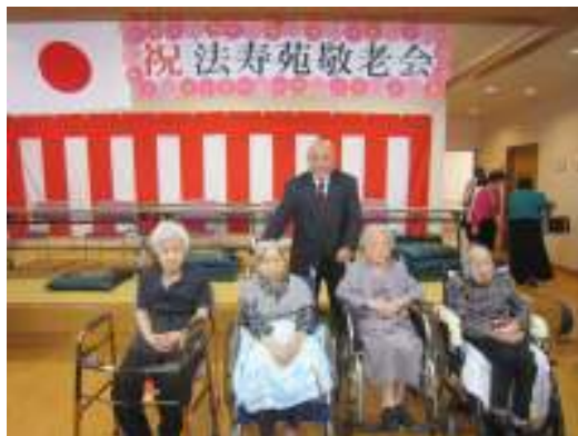
施設長と記念撮影

お祝いの余興として、『グリーンハーモニー』の皆様による大正琴の演奏が式典に華を添えてくださいました。ありがとうございます。参加された皆様一人ひとりが、家族様や職員と記念写真を撮ったり、談笑されたりと和気藹々とした時間を過ごされていました。そのような笑顔が見られた事が、何よりのお祝いとなったかと思えます。本当におめでとうございます。これからも、変わらずお元気でいらしてください。