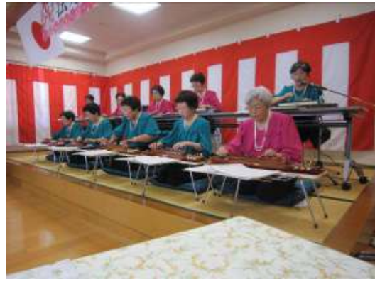
素敵な演奏をありがとうございました