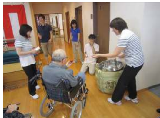
祝い酒も振舞われました